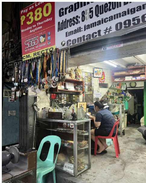
Larawan 3: Kuhang larawan sa Recto Avenue sa isang stall ng document printing service na nagpapakita ng loob