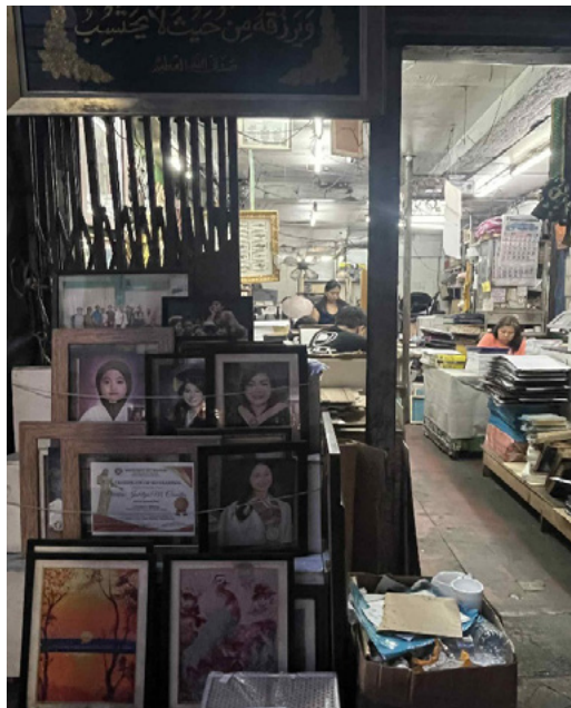
Larawan 2: Kuhang larawan sa Recto Avenue sa isang stall ng document printing service

Kung susuriin ang Recto University, hayag na espasyo itong nalilikha dahil sa pangangailangang ekonomikal ng mga taong umookupa rito. Gayunman, nagsisilbing espasyo rin ito ng mga estudyante, komyuter, manggagawa,