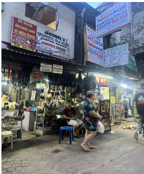
Larawan 1: Kuhang larawan sa Recto Avenue sa isang bahagi ng bangketa na inookupahan ng document printing services

Maikukumpara sa isang malaking mall na bukas at hindi nakakahon ang istruktura ang kahabaan ng Recto Avenue dahil sa dami ng mga street vendor na umookupa sa mga bangketa nito. Isang kapansin-pansin dito ang tindahan na nag-aalok ng serbisyo ng document printing, laminating, at binding na animo mga printing press. Madaling makita ang mga stall na ito dahil na rin sa malalaking